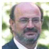
José Campos Trujillo Secretario General FE CC.OO.

DESDE hace tiempo venimos apostando por un Pacto de Estado por la Educación con el objetivo de dotar de estabilidad a nuestro sistema educativo más allá de cualquier legislatura marcada por un determinado color político.