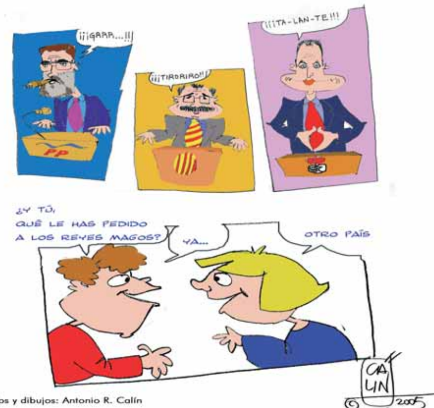
Textos y dibujos: Antonio R. Calín

Según un estudio sobre videojuegos y menores, presentado por el Defensor del Menor de la Comunidad de Madrid y la ONG Protégeles, uno de cada tres niños y adolescentes de 10 a 17 años usa videojuegos para mayores de edad, el 57% de ellos reconoce que mata o tortura personas en esos juegos y el 35% dice que dedica más de una hora diaria entre semana a esta diversión.