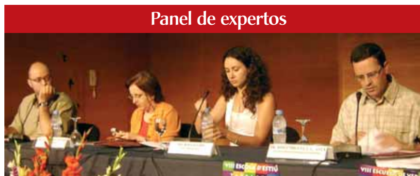
Panel de expertos

Obach dijo que cada vez hay más noticias que vinculan la enseñanza con sucesos violentos o dificultades para la convivencia lo que, en su opinión, contribuye a crear en la sociedad la sensación de que el entorno educativo, especialmente el instituto, es un lugar complicado, "arriesgado" o "difícil". Obach comentó que con frecuencia el mundo de la docencia expresa una doble queja respecto al trato que reciben desde los medios de comunicación. Para modificar su imagen pública propuso promover la formación en materia de medios de comunicación para todos los escolares.