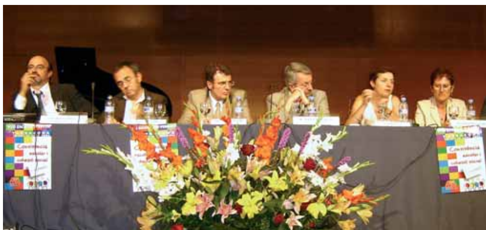
Miembros de la mesa que inauguró la VIII Escuela de Verano de la FE CC.OO.