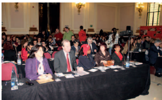
Delegación internacional asistente a las Jornadas.