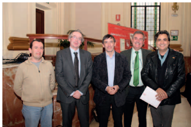
Integrantes de la mesa redonda sobre Formación.

“Hay que desarrollar la Ley de las Cualificaciones y de Formación Profesional”