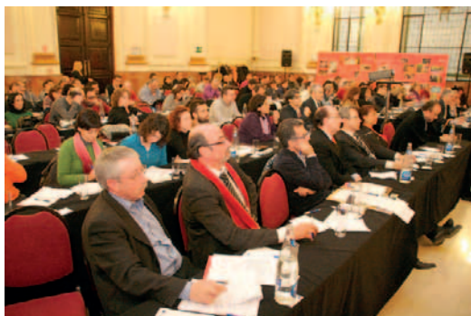
Asistentes a las Jornadas.