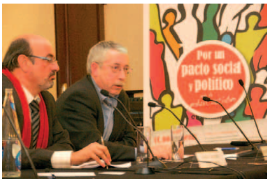
Campos y Toxo durante la Conferencia de éste.