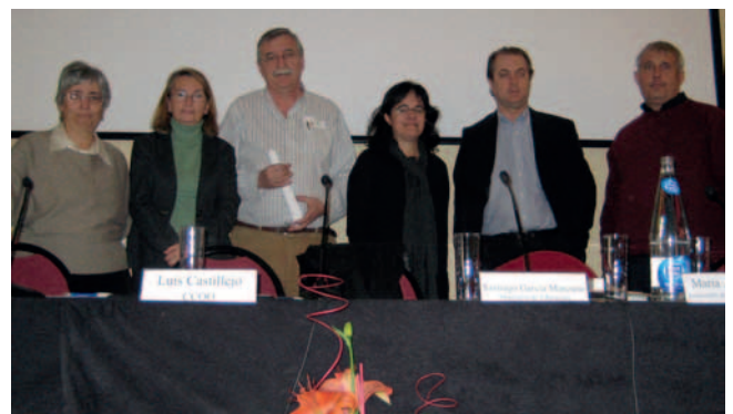
Integrantes de la mesa sobre condiciones laborales.

“El Pacto educativo se reconozca la tarea educativa del PSEC”