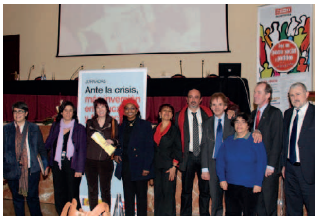
Sindicalistas de la Internacional junto a representantes de FECCOO.