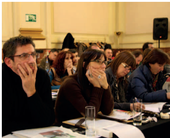
Asistentes a las Jornadas.

La secretaria de Estado de Educación, Eva Almunia, dijo en su intervención que en educación y formación “es posible alcanzar un pacto para salir de la crisis económica y no desde las trincheras ideológicas”. En este sentido, se hizo eco de una idea ya formulada por el ministro de Educación: “Hagamos de la educación algo generacional y no electoral”. Almunia dijo que esperaba que el país salga de la crisis “reforzados de la mano de la educación”. Precisó que los programas educativos emprendidos por el Ministerio, como Escuela 2.0, para implantar nuevas tecnologías en las escuelas, el Educa 3, que fomenta la creación de plazas escolares y de empleo en el sector y la reforma de la Formación Profesional, que propugna una mayor flexibilidad en estas enseñanzas y la vincula al trabajo y a los nuevos yacimientos de empleo. También advirtió de la aparición de nuevos perfiles profesionales y de nuevas competencias ligadas fundamentalmente al sector servicios. A este respecto recordó que los diez empleos más solicitados en Estados Unidos a lo largo de 2009 no existían en 2004.