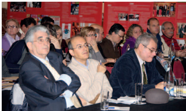
Asistentes e invitados a las Jornadas.