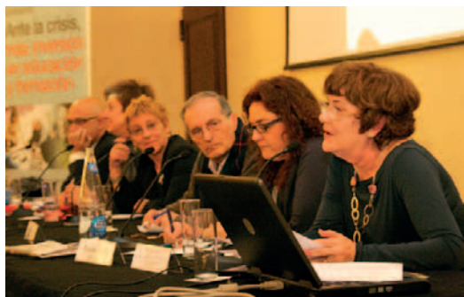
Integrantes de la mesa redonda del Pacto por la Educación.