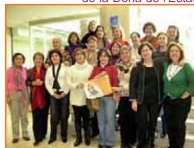
Responsables de les secretaries de la Dona de l'Estat

Actualment es produeixen canvis legislatius d'interès per a una pràctica educativa a favor de la igualtat d'oportunitats i de drets entre els sexes. Aquests canvis responen a reivindicacions insistentment plantejades per organitzacions feministes, sindicats d'ensenyament i, en general, per bona part de la societat que rebutja la discriminació social, econòmica i política de les dones. Aquestes lleis s'han de traslladar a l'àmbit educatiu.